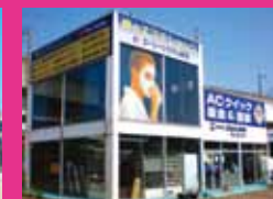
钣金・車のエステ